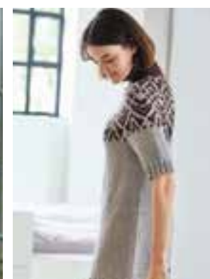
33 - COOL WOOL BIG & COOL WOOL BIG MÉLANGE