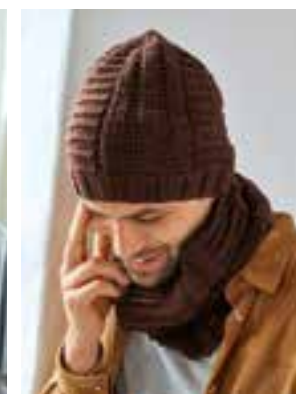
23 & 24 - BINGO