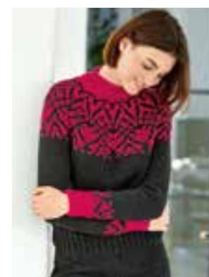
32 - COOL WOOL BIG & COOL WOOL BIG MÉLANGE