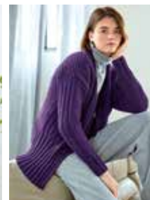
22 - BINGO MÉLANGE