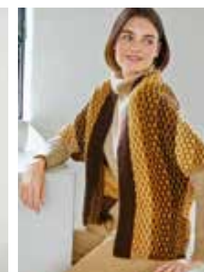
44 - COOL WOOL & COOL WOOL MÉLANGE