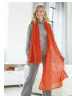
27 - COOL WOOL LACE