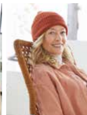
42 - COOL WOOL