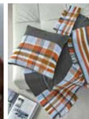
37 & 38 - COOL WOOL BIG & COOL WOOL BIG MÉLANGE