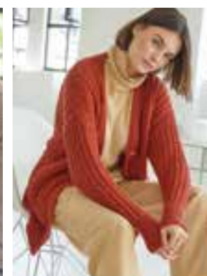
41 - COOL WOOL BIG