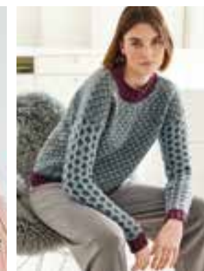
30 - COOL WOOL BIG & COOL WOOL BIG MÉLANGE