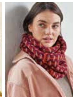
29 - COOL WOOL BIG