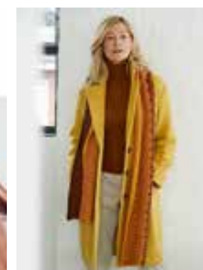
43 - COOL WOOL