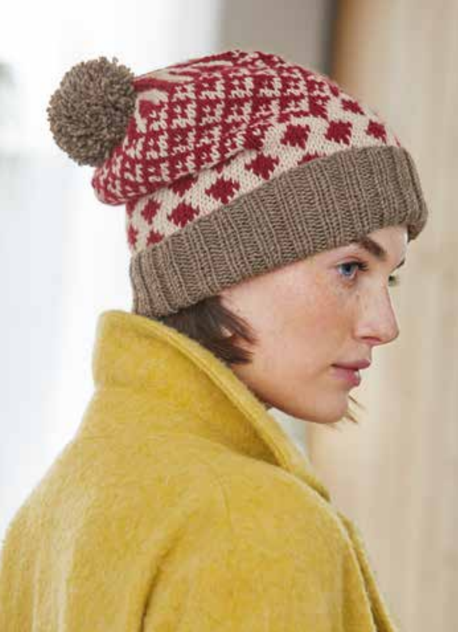
28 Mütze Cool Wool Big Mélange & Cool Wool Big