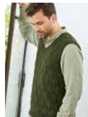
21 - COOL WOOL