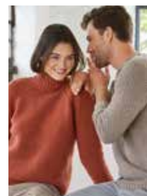
39 / 40 - COOL WOOL / COOL WOOL MÉLANGE