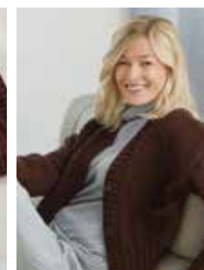
36 - MERINO UNO