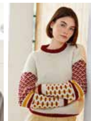
31 - BINGO