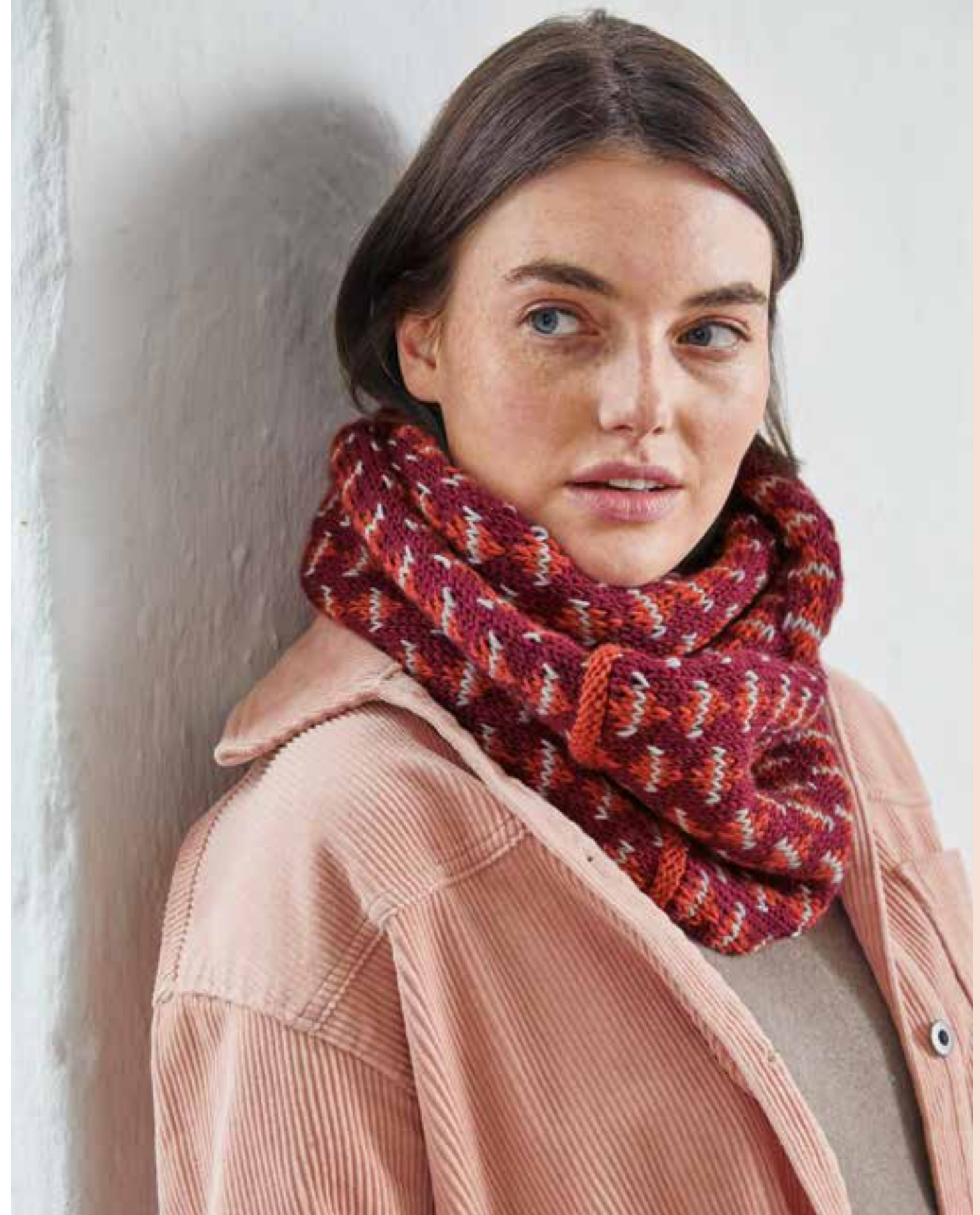
29 Loop Cool Wool Big