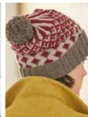
28 - COOL WOOL BIG MÉLANGE & COOL WOOL BIG