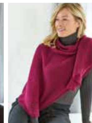
26 - COOL WOOL LACE