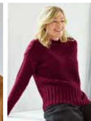
25 - COOL WOOL BIG